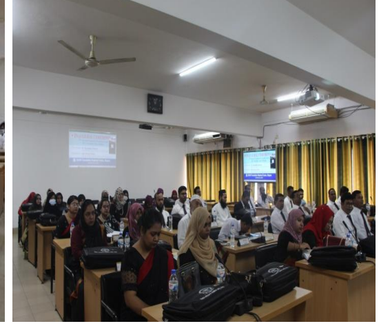
বর্তমান ক্লাসরুমের ছবি

বিয়াম ফাউন্ডেশন আঞ্চলিক কেন্দ্র, বগুড়ায় নিজস্ব অর্থায়নে অফিস ভবনের ২য় তলায় ৪০ আসন বিশিষ্ট ২টি আধুনিকমানের ক্লাসরুম ও অফিস ভবনের ৩য় তলায় ১টি ৬০ আসন বিশিষ্ট মোট ৩টি আধুনিকমানের ক্লাসরুম তৈরী করা হয়েছে। বর্তমানে এ প্রতিষ্ঠানে একই সঙ্গে ১২০জন প্রশিক্ষণার্থীকে প্রশিক্ষণ প্রদান করা সম্ভব হচ্ছে। ফলে প্রতিষ্ঠানের সক্ষমতা বৃদ্ধি পেয়েছে এর পাশাপাশি আয়ও বৃদ্ধি পেয়েছে।