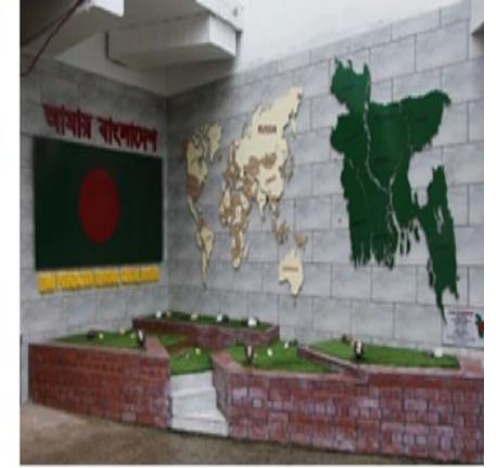
আমার বাংলাদেশ কর্ণারের ছবি ডে/নাইট ভিউ

বিশ্ব মানচিত্রের বুকে বাংলাদেশ ক্ষুদ্র একটি দেশ। কিন্তু নাগরিক হিসেবে আমার দেশ ও পতাকা আমার নিকট অনেক বড়। বুকের ভিতর লালিত বৃহৎ বাংলাদেশকে ফুটিয়ে তোলার জন্যই স্থাপন করা হয়েছে “আমার বাংলাদেশ কর্ণার”। “আমার বাংলাদেশ কর্ণার”-এ বিশ্ব মানচিত্রকে দুপাশ থেকে ধারণ করেছে আমার দেশ ও পতাকা। নিচে রয়েছে লাল সবুজের বেদী। রক্তস্নাত লাল সবুজের এ দেশে পতাকা উত্তোলিত হয়েছে ১৯৭১ সালে। লাল সবুজের বেদীটি রক্তস্নাত সবুজ বাংলাদেশকে বুঝায়। বিশ্বের যেখানেই থাকি না কেন আমার অস্তিত্ব জুড়ে আমার বাংলাদেশ। ক্ষুদ্র ভূখন্ডের একটি দেশ হলেও বিশ্বের বুকে বৃহৎ আকারে পরিচিত হোক লাল সবুজের আমার বাংলাদেশ। দেশপ্রেমকে জাগ্রত করার লক্ষ্যে এ কর্ণারটি স্থাপন করা হয়েছে।