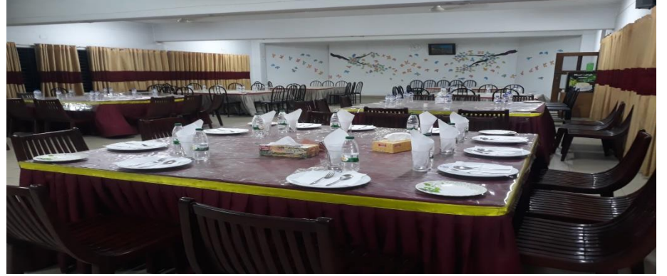
বর্তমান ক্যান্টিনের ছবি