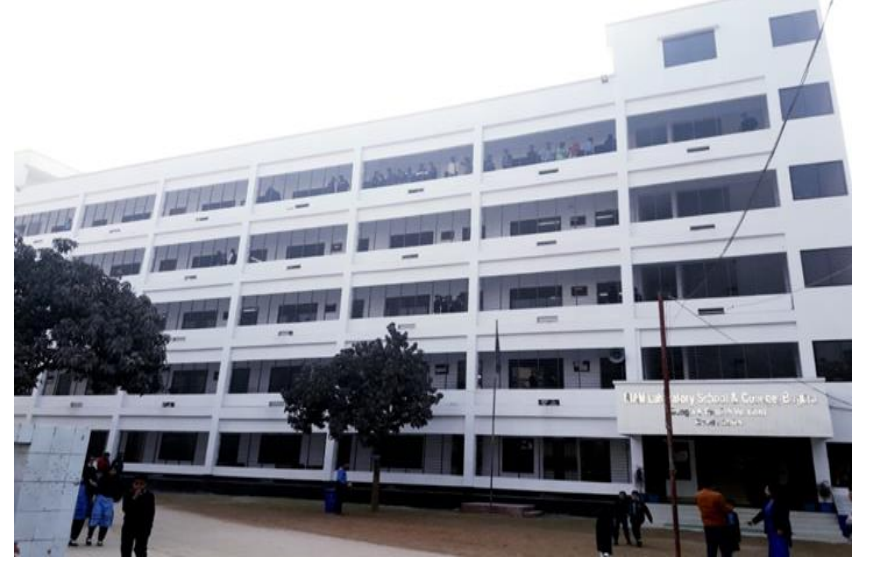
নবনির্মিত স্কুলের ছবি

বিয়াম ল্যাবরেটরী স্কুল ও কলেজ, বগুড়া বিয়াম ফাউন্ডেশনের একটি অঙ্গ প্রতিষ্ঠান। এ শিক্ষা প্রতিষ্ঠানটি ২১ মে, ২০০৪ সালে প্রতিষ্ঠিত হয়। এটি উত্তরবঙ্গের একটি স্বনামধন্য শিক্ষা প্রতিষ্ঠান। পূর্বে এ প্রতিষ্ঠানে শুধুমাত্র ইংরেজি ভাষনে পাঠদান দেয়া হত। নতুন ভবন নির্মাণ করায় ইংরেজি ভাষনের পাশাপাশি বাংলা ভাষন চালু করা হয়। এতে ছাত্র-ছাত্রীর সংখ্যাবৃদ্ধি ও প্রতিষ্ঠানের আর্থিক সক্ষমতা বৃদ্ধি পেয়েছে। বর্তমানে এ প্রতিষ্ঠানে মোট শিক্ষার্থীর সংখ্যা ১৯৪৩ জন (বাংলা ভাষনে- ১৪৩৩ জন ও ইংরেজি ভাষনে- ৫১০ জন)।