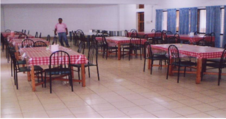
পুরাতন ক্যান্টিনের ছবি