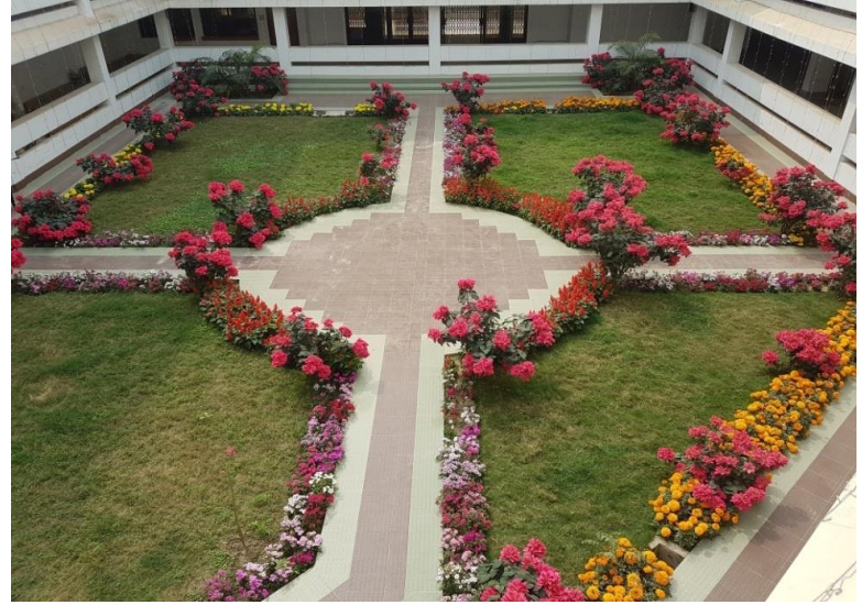
ডিজি'স চত্বরের বর্তমান ছবি

বিয়াম ফাউন্ডেশন আঞ্চলিক কেন্দ্র, বগুড়ার সৌন্দর্য বৃদ্ধির লক্ষ্যে প্রশাসনিক ভবনের অভ্যন্তরে একটি ফুলেল চত্বর নির্মাণ করা হয়। যা ডিজি'স চত্বর নামে পরিচিত। এখানে বিভিন্ন ব্যাচের প্রশিক্ষণার্থীদের সাথে ডিজি মহোদয়ের সহিত সৌজন্যমূলক চা-চক্রের আয়োজন করা হয়ে থাকে।