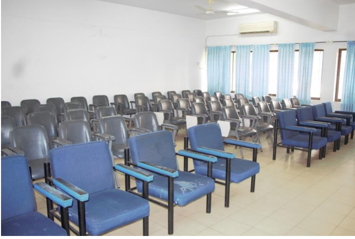
পূর্বের ক্লাসরুমের ছবি