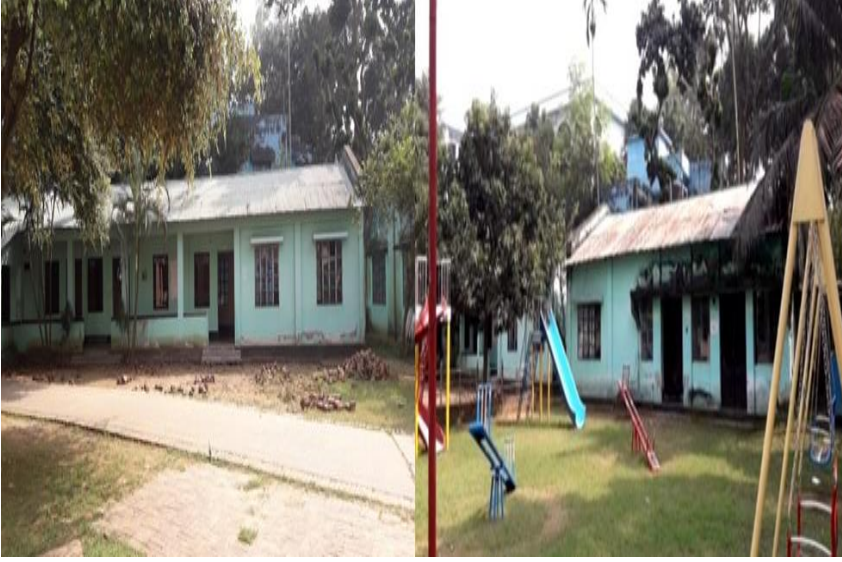
পূর্বের স্কুলের ছবি